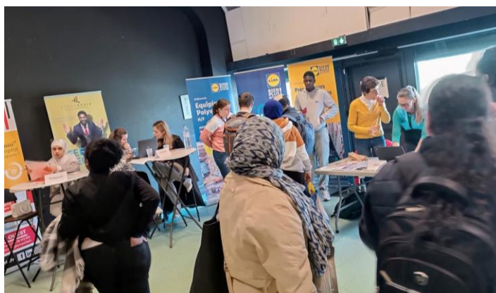
Forum « Village de l'emploi – Sillon de Bretagne, Saint-Herblain », Avril 2024, organisé par l'Atdec Nantes Métropole